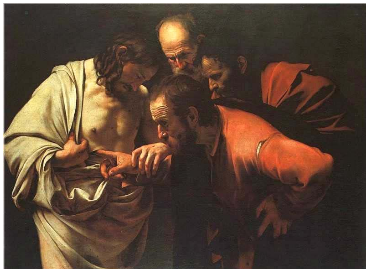
Gesù Risorto e Tommaso in una famosa tela del Caravaggio. In questo dipinto si concentrano tutto il dramma e la difficoltà della scelta di fede, essenziale per la salvezza eterna. "Beati coloro che, pur non vedendo, crederanno"

"Cristo Gesù... umiliò se stesso facendosi obbediente fino... alla morte di croce... Per questo Dio l'ha esaltato" (Fil 2,8-9). Abbiamo ascoltato poco fa queste parole dell'inno contenuto nella Lettera ai Filippesi. Esse ci presentano, in modo essenziale ed efficace, il mistero della passione e morte di Gesù; allo stesso tempo, ci fanno intravedere la gloria della Pasqua di risurrezione. Costituiscono, pertanto, una meditazione introduttiva alle celebrazioni del Triduo Pasquale, che ha inizio domani. Carissimi Fratelli e Sorelle, ci apprestiamo a rivivere nei prossimi giorni il grande mistero della nostra salvezza. Domani mattina, Giovedì Santo , in ogni Comunità diocesana il Vescovo celebra insieme col proprio presbiterio la Messa Crismale , nella quale vengono benedetti gli olii: l'olio dei catecumeni, quello dei malati e il sacro Crisma. Alla sera si fa memoria dell' Ultima Cena con l'istituzione dell'Eucaristia e del Sacerdozio. La " lavanda dei piedi " ricorda che, con questo gesto compiuto