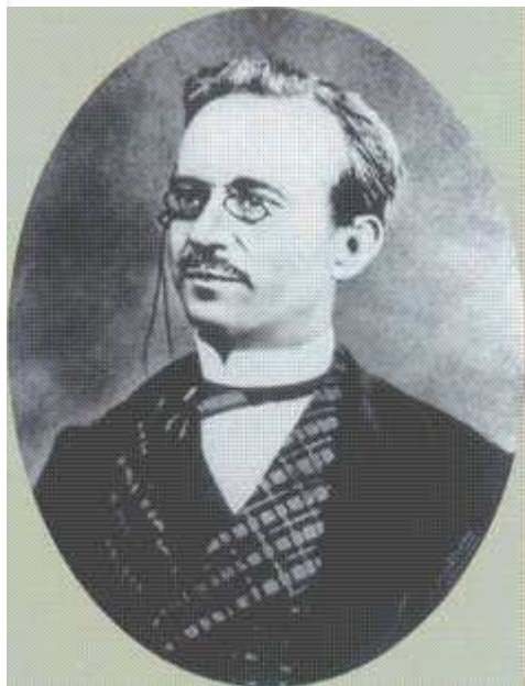
Il Ministro Rattazzi

male protesta. Il Rattazzi, che pur proveniva dalle fila democratiche, fiutando il peri-