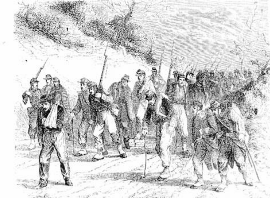
Truppe papaline battute a Monterotondo

Altri non si erano mossi in Roma e tanto meno nella campagna circostante. Garibaldi con 8000 uomini molto male armati, senza artiglierie e quasi privi di cavalli, raggiunse Menotti a Passo Corese ed insieme, poi, giunsero a Monterotondo dove si cercò di prendere un castello munitissimo difeso da 400 pontifici con due cannoni. Si tentò un colpo notturno, ma fallì. All'alba seguente si cercò di abbattere le tre porte, ma fu un nuovo scacco. Alle tre della notte successiva, una porta venne finalmente bruciata e i garibaldini conquistarono Monterotondo quando i pontifici si arresero. Per tre giorni Garibaldi si fermò a Monterotondo poi si avvicinò a Roma, ma da di dentro non giungevano rumori di alcun tipo di lotta, infatti, nessuno in città si muoveva, in Roma era concentrato il grosso dell'esercito pontificio, 15000 uomini. Il governo italiano, nel frattempo,