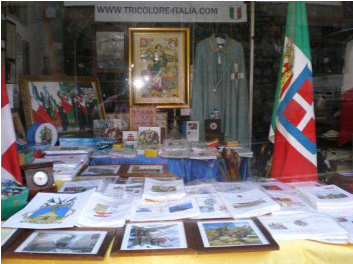
Vetrina della sede Umbra dell'Associazione Culturale Tricolore, dell'Associazione Internazionale Regina Elena e dell'Associazione Nazionale Bersaglieri sez. di Orvieto